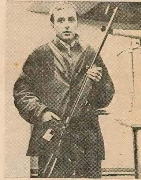
— Зрок у мяне самы звычайны, а многія майстры стральбы нават носяць акуляры. Што датычыць «цвёрдай рукі», то тэхніка валодання зброяй прыходзіць з часам.

— Гаворач, стралку неабходна мець выключна востры зрок і цвёрдую руку. Якім жа ты бачыш спартсмена-стралка?